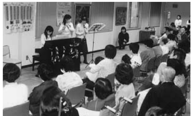
さわやかな演奏で春のひとときを楽しむ患者さんたち ＝西病棟1階合同カンファレンスルーム

当日は、人形劇サークルによる第1部「人形劇と紙しばい」、金沢大学生の琴、尺八、三味線と本院看護部有志のフルートとピアノ合奏による第2部「早春のしらべ」、うたと手遊びの第3部「みんなで楽しく」の3部構成で行われた。