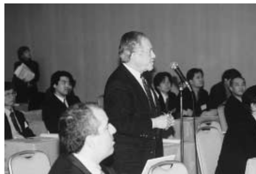
質問する米国のがん研究者

3月12, 13日「金沢がん生物 学国際シンポジウム2003」が, がん研究所と東京大学医科学研 究所の共催で開催され, 100名 を超す研究者が参加した。