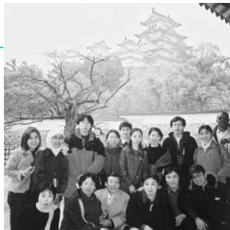
3月3日、 姫路城の前にて