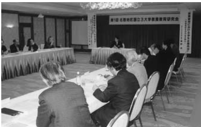
意見交換を行う3大学の教官 =金沢市内のホテル

3月29日、北陸地区国立3大学教養教育実施組織連絡協議会的主催により第1回北陸地区国立3大学教養教育研究会が開催された。