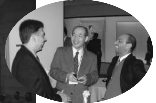
意見交換を行う研究者