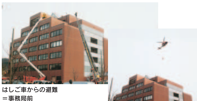
はしご車からの避難 =事務局前