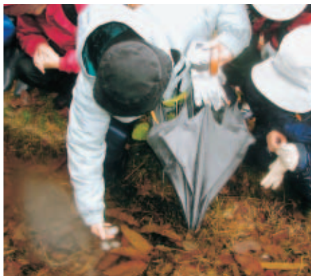
クロサンショウウオの観察

3月8日、雨あられ中、里山ゾーン南半分の道のない尾根を探検した。尾根には旧道の跡が残っており、これをたどって南谷を下った。山中ではちょうどキクバオウレンが花の時期を迎えていた。また、山すその止水域ではアカガエルの仲間やクロサンショウウオの卵塊なども観察した。これらは2月下旬から3月上旬の短期間に山すその止水域に下りて交尾・産卵し、再び山に戻るという。