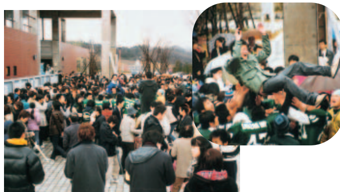
前期日程合格者発表風景 =3月8日、大学会館前

平成15年度学部入学選抜試験については、3月8日に前期日程の合格者1,453名が、同22日に後期日程の370名がそれぞれ発表された。