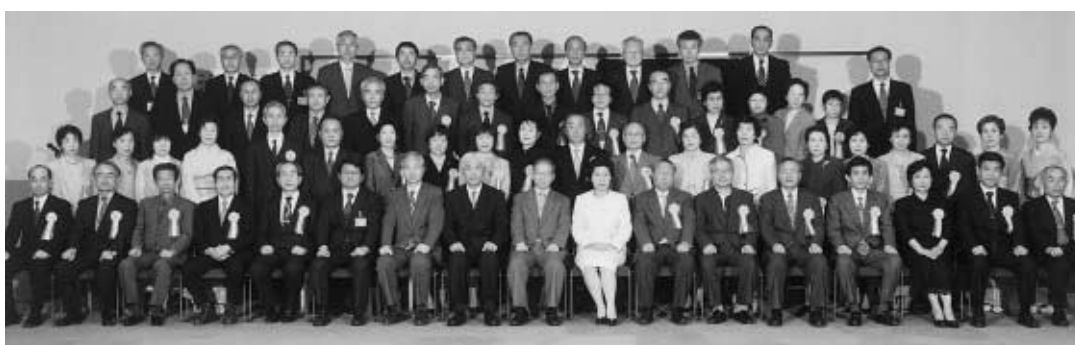
記念式に出席した教職員 = 事務局大会議室