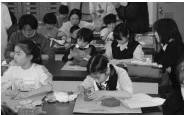
ねんどでやきものを作る小学生 ＝3月23日、理学部地球学科第2学生実験室

3月23日・30日の両日、理学部において地球学公開セミナー「ねんどと岩石ーやきものはカメレオン？」が、理学部地球学科と金沢美術工芸大学の共同事業として開催された。やきものセミナーは昨年に続いて2回目、参加者は30名にのほりににぎやかなセミナーとなった。