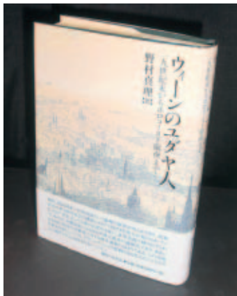
受賞対象となった著書「ウィーンユダヤ人 —九世紀末からホロコースト前夜まで」(御茶の水書房)

「地味な研究が受賞対象となって喜んでいる。金沢大学は、情報量や研究会への参加などの点では不利といわれる地方都市にあるが、じっくりと研究させてもらえる環境にある。今回受賞の対象となった著書は金沢大学に来てから書いたもので、研究調査のため2回も外国に出張させていただいた金沢大学と経済学部感謝している。」